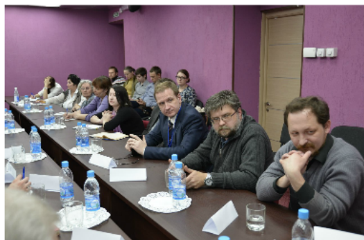
Круглый стол «Локальная история vs Краеведение»

• Интерактивные online-проекты по патриотическому воспитанию жителей Перми и Пермского края: