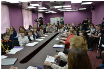
Школьная конференция «На пути к Победе (1941-1945)»

• архив не просто является упорядоченным хранилищем документов, но мощным агентом воздействия на социальное пространство в целом;