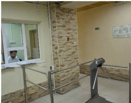
Пропускной пункт в здании Государственного архива Пермского края

Политика безопасности – набор норм, правил и практических приемов, которые регулируют управление, защиту и распределение ценной информации.