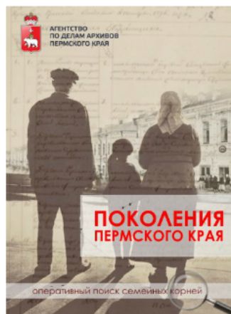
Проект «Поколения Пермского края»

• Задача современного архива – анимировать артефакты, пробуждать историческую память.