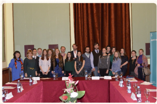
Финал конкурса эссе для школьников по истории театра в Перми