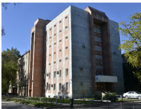
Здание Государственного архива Пермского края

Миссия архива – это его философия и предназначение, смысл его существования; то, что определяет общую цель его деятельности.