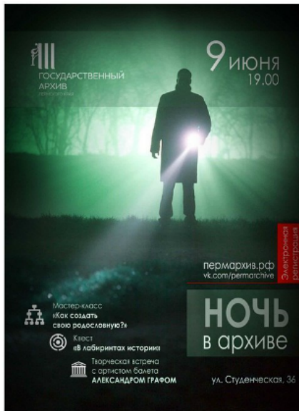
Афиша акции «Ночь в архиве»

• использование архивных документов должно быть тесным образом сопряжено с деятельностью по формированию мемориальной культуры граждан;