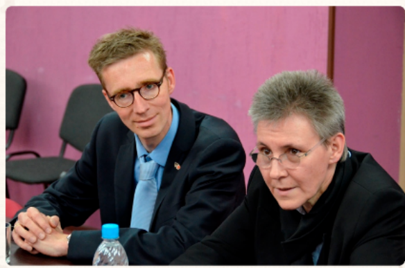
Делегация из Архива г. Дуйсбурга в Краевом архиве