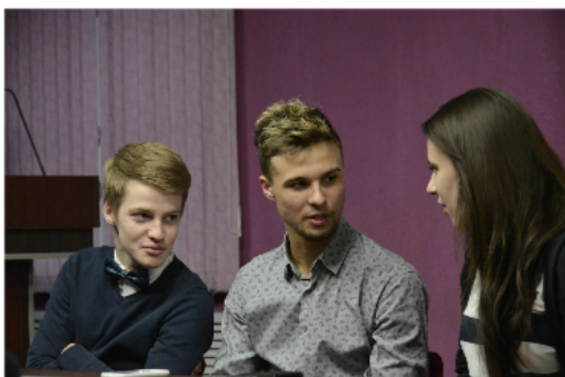
Заседание клуба «Музыкальная шкатулка» с участием студентов-историков из Высшей школы экономики