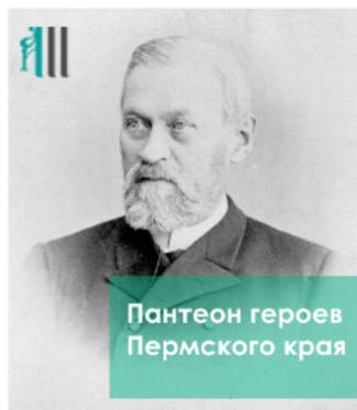
Проект «Пантеон героев Пермского края»