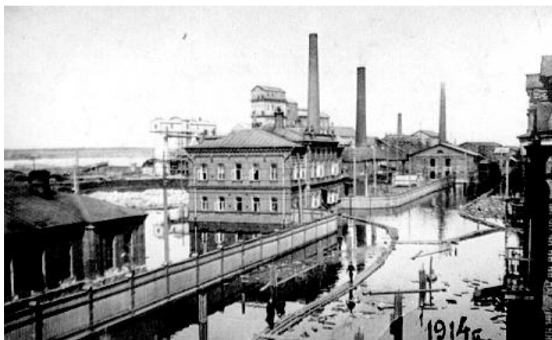
Березниковский содовый завод во время наводнения.

За 35 лет со дня основания завода до революции завод дал 875 тыс. тонн кальцинированной соды или в среднем по 25 тыс. тонн в