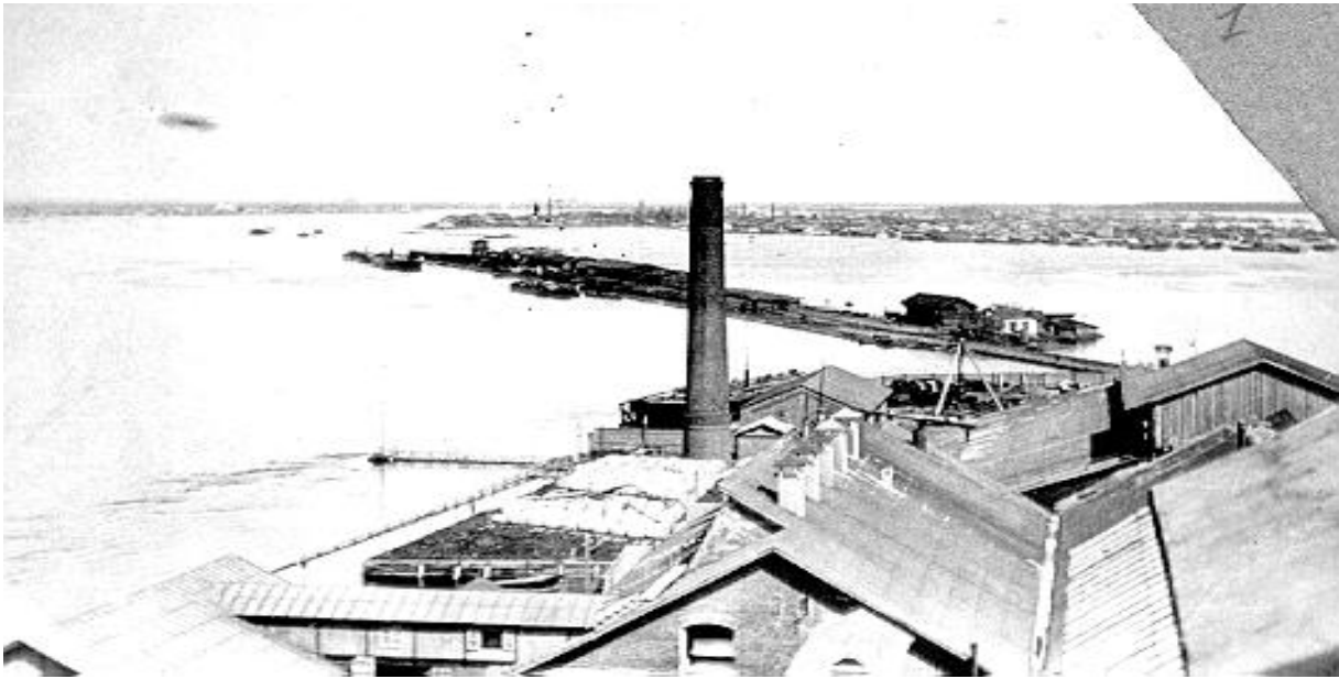
Весеннее наводнение в 1914 г. На переднем плане - Березниковский содовый завод. В дали - пос.Ленва.

год. Но даже для скромных нужд царской России этого было мало. Только после пуска Донецкого содового завода в 1892 году импорт