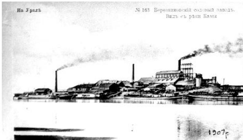
Корпуса Березниковского содового завода.

Далее газета сообщала: “Березниковский содовый завод, принадлежащий товариществу, предназначается по окончательному своему