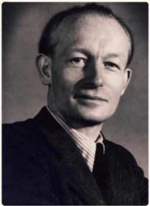
Адольф Рейхенвейн (1898-1944)

Выдающийся немецкий педагог, автор термина «музейная педагогика»